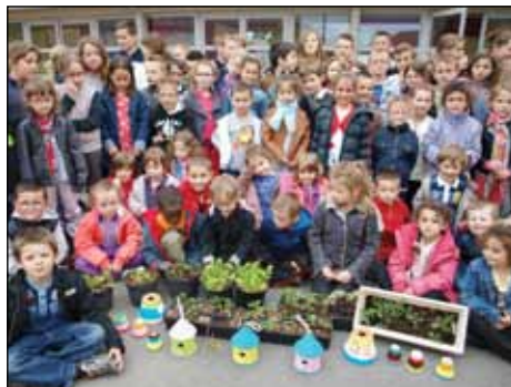
Printemps de Chamblet 2014

La commission extra-municipale, recomposée suite aux élections de mars 2014, a retenu le dimanche 12 avril pour la journée publique du Printemps de Chamblet dont le thème sera « les cinq sens ».