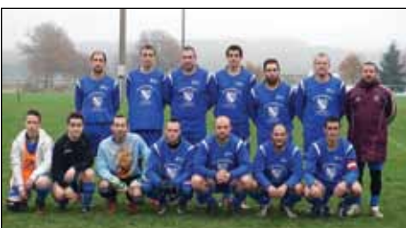
L'ESC au pied du podium à mi-parcours

À la mi-saison malgré plusieurs blessés, l'équipe A est quatrième de la poule D en première division. De son côté, l'équipe B est huitième de la poule B en troisième division. Nous remercions les habitants de la commune pour leur accueil lors du passage des calendriers.